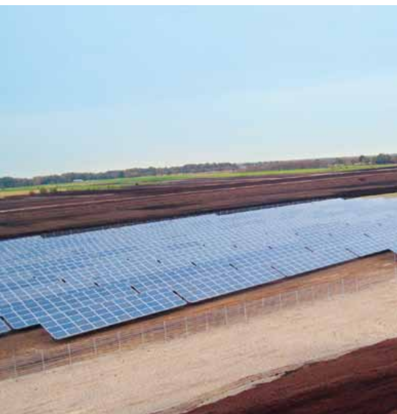
Der Solarpark Georgsdorf: Mit jährlich rund 23 Millionen Kilowattstunden sauberem Strom ist er der größte Solarpark Niedersachsens.

Die Solarhybridanlage in Tsumkwe: Mit einer Leistung von 200 Kilowatt, einem Batteriespeicher mit einer Kapazität von einer Megawattstunde und drei integrierten Dieselgeneratoren liefert die Anlage 24 Stunden am Tag zuverlässig Strom.