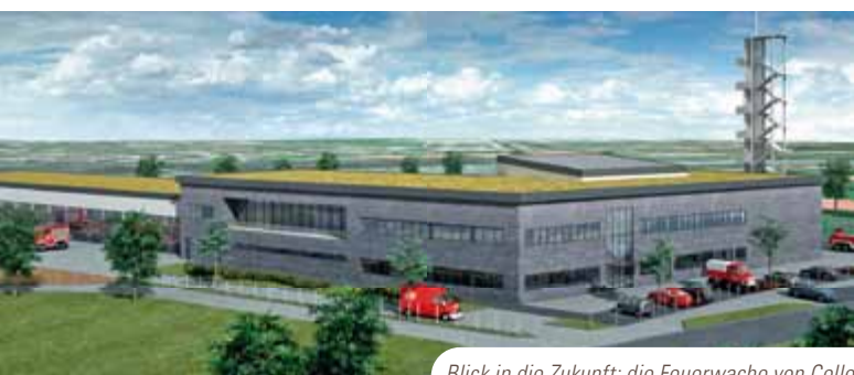
Blick in die Zukunft: die Feuerwache von Celle.

Mit gutem Grund hat die Stadt Celle bei der Planung ihrer neuen Hauptfeuerwache die Spezialisten von juwi ins Boot geholt. Bereits 2007 hatten die Fachleute die weltweit erste Feuerwache in Passivhaus-Bauweise in Heidelberg konzipiert – damals noch unter dem Dach der ISP Ingenieurgesellschaft mbH Strunk + Partner, die mittlerweile in die juwi Green Buildings GmbH integriert wurde.