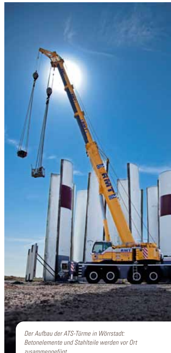
Der Aufbau der ATS-Türme in Wörrstadt: Betonelemente und Stahlteile werden vor Ort zusammengefügt.

In zukünftigen Konstruktionen will ATS noch ein wenig höher hinaus – mit einer Nabenhöhe von mindestens 145 Metern erreicht man noch einige Prozentpunkte mehr Ertrag. Und kann so Binnenstandorte noch besser nutzen.