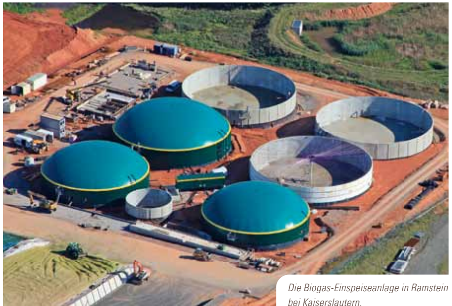
Die Biogas-Einspeiseanlage in Ramstein bei Kaiserslautern.

in der eigentlichen Aufbereitungsanlage zu Biomethan in Erdgasqualität veredelt. Das eingesetzte Aufbereitungsverfahren entfernt das Kohlendioxid aus dem Biogas ohne die Zugabe von Chemikalien. Das auf diese Weise gewonnene Biomethan besitzt einen Methangehalt von mehr als 97 Prozent und erfüllt die nach Erneuerbaren-Energien-Gesetz und Gasnetzzugangsverordnung geforderte Qualität für die Einspeisung. Es wird direkt in das vorhandene Erdgasnetz der Kommunalen Netzgesellschaft Südwest mbH eingespeist.