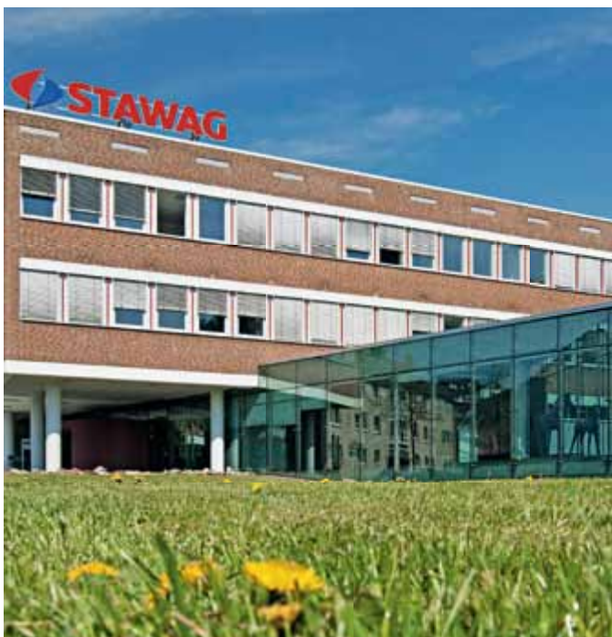
Der Unternehmenssitz der STAWAG in Aachen.