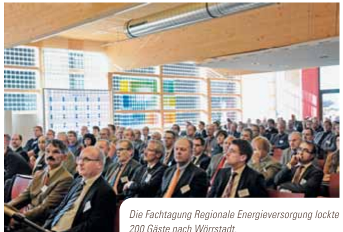
Die Fachtagung Regionale Energieversorgung lockte 200 Gäste nach Wörrstadt.

Über 200 Vertreter von Städten, Gemeinden und Unternehmen diskutierten Anfang Oktober in Wörrstadt über genossenschaftliche Modelle für eine demokratische Energiewende. Sie trafen sich zur vierten Fachtagung »Regionale Energieversorgung«, die juwi gemeinsam mit dem Genossenschaftsverband e.V. und dem Gründungs- und Kompetenzzentrum für Genossenschaften (GenoPortal) organisiert hat. »Wir zeigen, wie die Energiewende funktionieren kann. Mit dezentraler Energieproduktion aus regenerativen Energiequellen und der Einbindung regionaler Energieversorger und Stadtwerke«, sagte René Rothe, Vorstandsmitglied des Genossenschaftsverbandes.