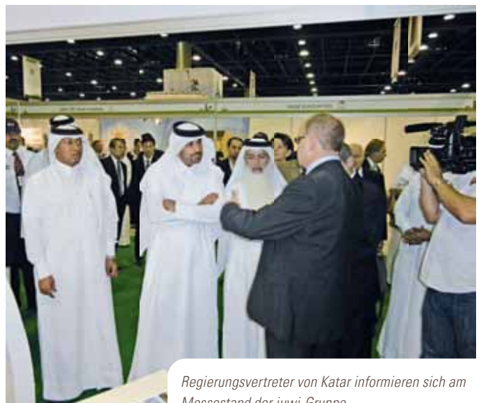
Regierungsvertreter von Katar informieren sich am Messestand der juwi-Gruppe.

Umdenken im Land des Erdölreichtums. Auf der ecoQ in Katar ging es Anfang Oktober um die neuesten Entwicklungen im Bereich erneuerbare Energien. Auch juwi war vor Ort und konnte sogar den katarischen Umweltminister His Excellency Abdullah Bin Mubarak Al Midhadi am Stand empfangen. Das Interesse des Ministers und auch der anderen Besucher galt vor allem der Photovoltaik und deren Möglichkeiten im Allgemeinen. Auf der politischen Ebene wird der Umstieg auf erneuerbare Energien schon jetzt gefördert mit der sogenannten Katar National Vision 2030. »Das Bewusstsein für regenerative Energien ist durchaus vorhanden, aber die Umsetzung konkreter Projekte wird sicherlich noch dauern und erfordert weitere Überzeugungsarbeit«, sagt Martin Görner von juwi Solar. »Was uns dabei unterstützt, ist der Wettbewerb der Golfstaaten untereinander. So treibt jedes Projekt in einem der Staaten das Interesse der anderen Staaten mit voran.«