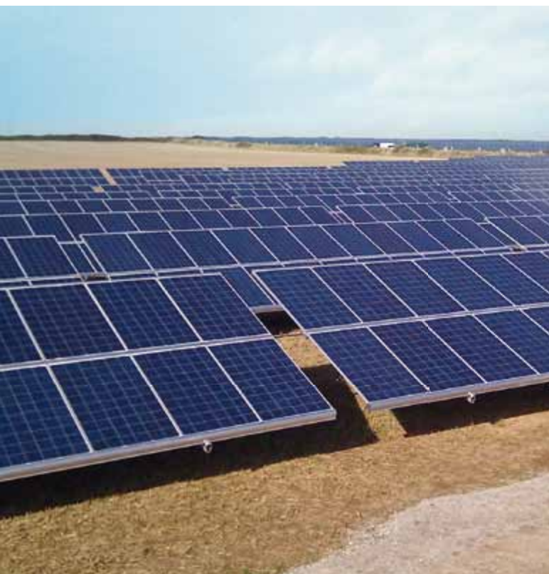
Seit September 2011 ist die Freiflächenanlage in Treveper mit einer Leistung von 638 kWp in Betrieb.