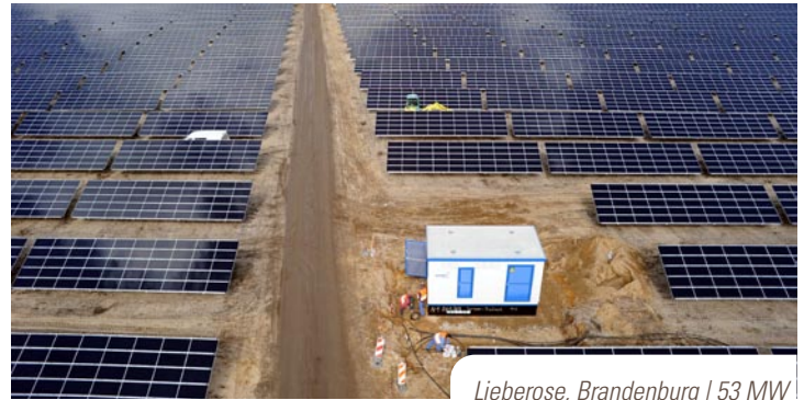
Lieberose, Brandenburg | 53 MW p