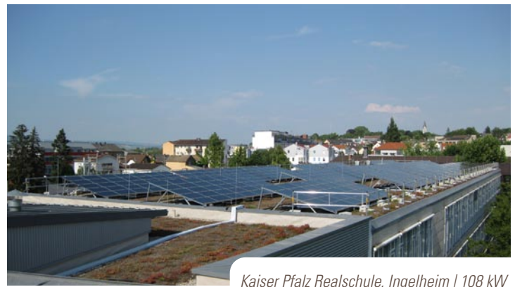
Kaiser Pfalz Realschule, Ingelheim | 108 kW p