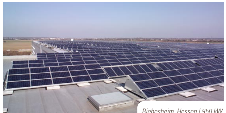
Biebesheim, Hessen | 950 kW p