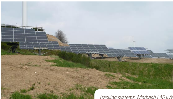
Tracking systems, Morbach | 45 kW p